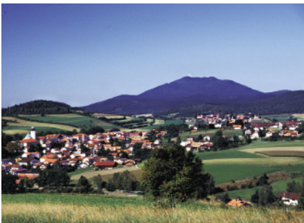
Ferienregion Lamer Winkel

Eine Insel der Geborgenheit für gestresste Eltern, zugleich ein Abenteuerspielplatz für Kinder.